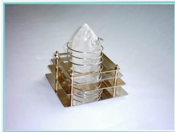
DAS HEILICHT IST AN DER BASIS 13X13CM UND 7CM HOCH. DER ABGEBILDETE KRISTALL HAT EINE HÖHE VON 11CM, BEI EINEM DURCHMESSER VON 6,5CM

Der Magnetismus stellt hierbei die grundsätzlichen Lebensfunktionen wieder her, da die Plus- und Minuszustände in denen jedes organische Wesen funktioniert, ausgeglichen werden und daher als Folge Ausgleich/Heilung eintritt.